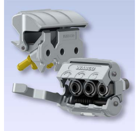
Neue WABCO TrioMatic Kupplungen