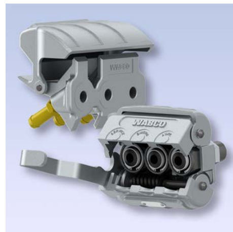
Nové WABCO TrioMatic spojkové hlavice