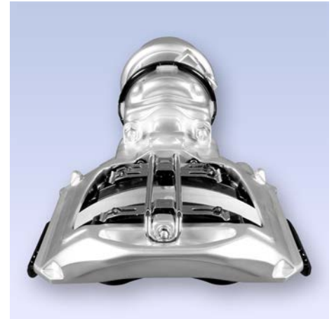
Freno neumático de disco MAXX™22T

Por este motivo, siempre que se intervenga en el sistema de frenos se deberá colocar un letrero de aviso en el volante.