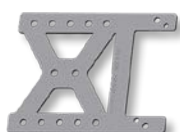
Внешний колесный модуль