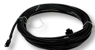
Aansluitkabel voor aanhangwagens

Voor de parametrering van de nieuwe OptiTire ECU is de diagnosesoftware OptiTire V4.00 vereist.