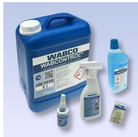
Produse chimice WABCO cu etichete noi

O investiție mică în produsul de întreținere corect poate face o mare diferență la costurile de viață, de serviciu și de întreținere pe termen lung a vehiculului.