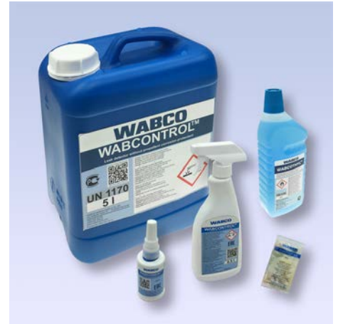
Prodotti chimici WABCO con nuove etichette

Un piccolo investimento nel prodotto di manutenzione giusto può avere un grande effetto sulla durata e la sostenibilità a lungo termine dei costi di manutenzione.