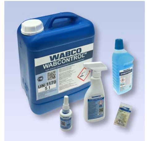
Produits chimiques WABCO portant les nouvelles étiquettes

Un petit investissement dans le bon produit d'entretien peut, à long terme, avoir des répercussions importantes sur la durée de vie et les frais d'entretien du véhicule.