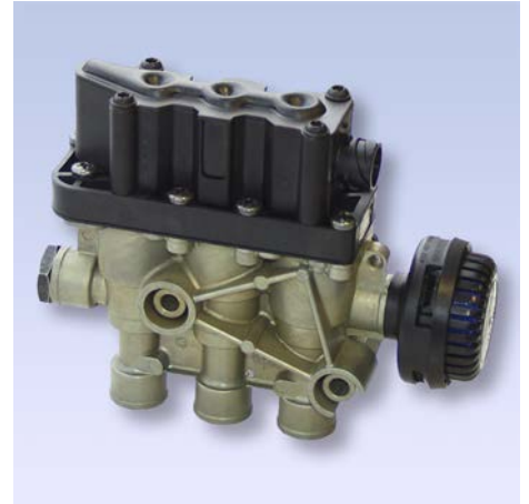
Elettrovalvola ECAS3 472 880 xxx 0

Di seguito sono riportate informazioni sui nuovi codici identificativi ECAS3 e relativi kit di riparazione. Tutte le valvole ECAS3 e relativi kit di riparazione in elenco sono disponibili. L'ECAS1 non sarà più disponibile a partire da inizio 2016, affrettatevi a prenotare l'ECAS3. Per eventuali domande rivolgetevi al Vostro partner WABCO.