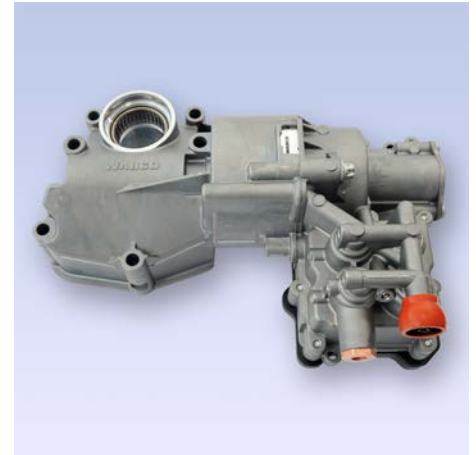
WABCO schakelcilinder 421 350 087 0, 421 350 088 0

Daarbij gaat het om speciaal voor de fabrikanten van bedrijfswagens ontwikkelde aandrijfcomponenten, die de schakelinrichting geautomatiseerd aansturen.