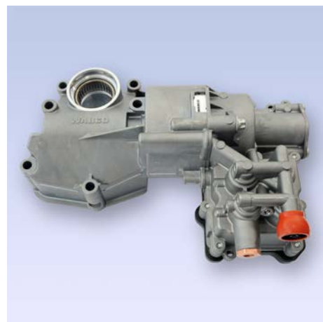
Cilindri marcia WABCO 421 350 087 0, 421 350 088 0

Questi componenti sono stati sviluppati specialmente per veicoli commerciali che controllano automaticamente il cambio.