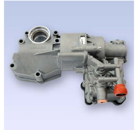
Cilindri marcia WABCO 421 350 087 0, 421 350 088 0

Questi componenti sono stati sviluppati specialmente per veicoli commerciali che controllano automaticamente il cambio.