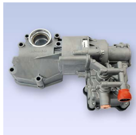
Cylindre de vitesse WABCO 421 350 087 0, 421 350 088 0

Ici, il s'agit de composants de transmission, qui activent automatiquement le changement de vitesse, développés spécialement pour les constructeurs de véhicules industriels.