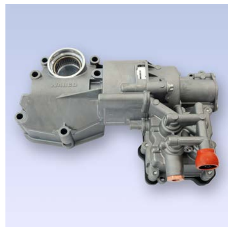
Cilindro de marcha WABCO 421 350 087 0, 421 350 088 0

Estos componentes han sido desarrollados especialmente para vehículos industriales que controlan automáticamente la caja de cambios.