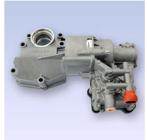
Κύλινδρος ταχυτήτων WABCO 421 350 087 0, 421 350 088 0

Πρόκειται για ειδικά για κατασκευαστές επαγγελματικών οχημάτων σχεδιασμένα στοιχεία κιβωτίων ταχυτήτων, τα οποία ενεργοποιούν αυτόματα το κιβώτιο ταχυτήτων.