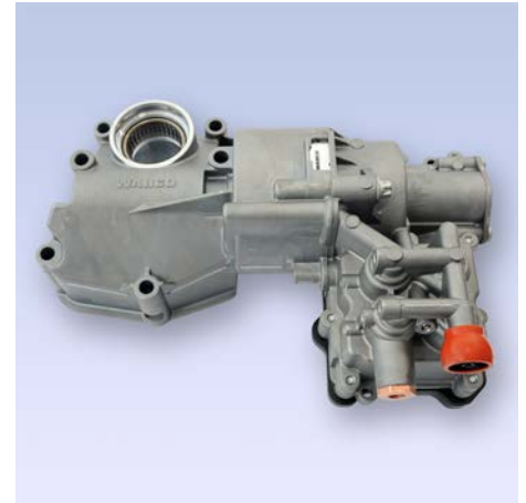
WABCO Gangzylinder 421 350 087 0, 421 350 088 0

Hierbei handelt es sich um speziell für Nutzfahrzeughersteller entwickelte Getriebekomponenten, die das Schaltgetriebe automatisiert ansteuern.