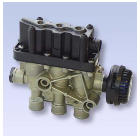
ECAS3 электромагнитный клапан 472 880 xxx 0