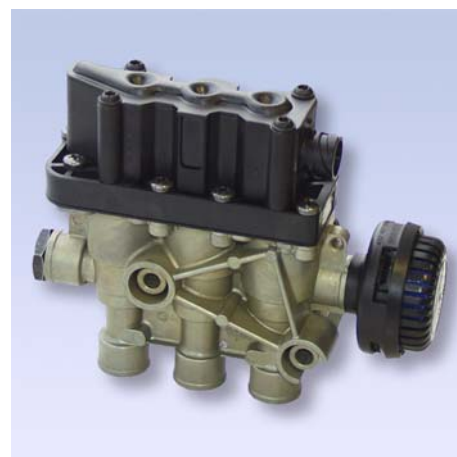
Electrovalve ECAS3 472 880 xxx 0