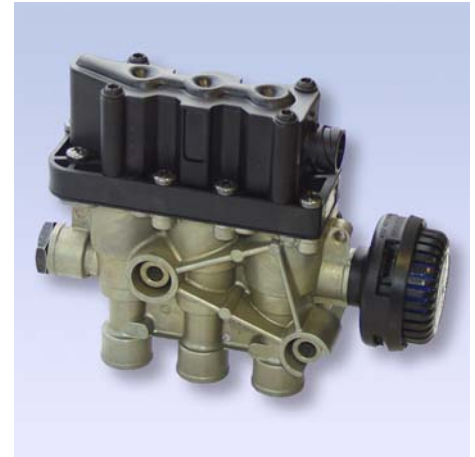
Electrovalve ECAS3 472 880 xxx 0