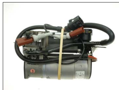
Grupo compresor para automóvil Audi A8

El compresor es la pieza clave y el componente central del sistema de suministro de aire comprimido (Air Supply Unit = ASU). Normalmente, en caso de reparación el fabricante original ofrece la ASU completa como pieza de repuesto. La solución alternativa que WABCO propone para la reparación es más económica, ya que contempla únicamente la sustitución del compresor.