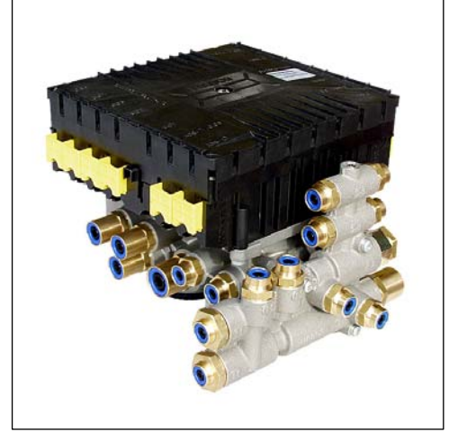
TEBS E modulator 480 102 06x 0

Yeni modülator, kurulum ve işlev bakımından önceki sürümlerle aynıdır.