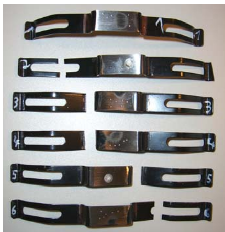
Рис. 2: Сломанные прижимные пружины стороннего производителя

Испытания показали, что срок службы пружин составляет лишь 0,8 – 12,0 процентов от нормы. Учитывая такой преждевременный выход из строя, стоит отметить, что представленные пружины ломаются задолго до их предельного износа.