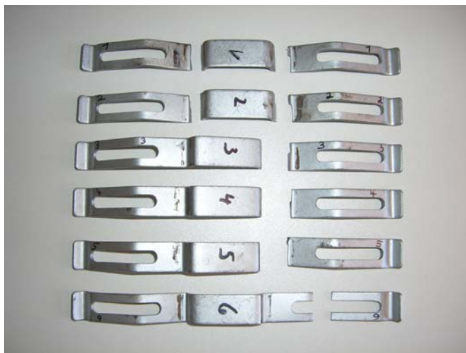
Fig. 2: Le molle di pressione spezzate del produttore estraneo

I risultati dei test dimostrano che le molle coprono una durata utile solo tra 1,8 - 4,5 percento. Le presenti molle utilizzate possono rompersi molto prima del limite di usura previsto a causa di guasti precoci.