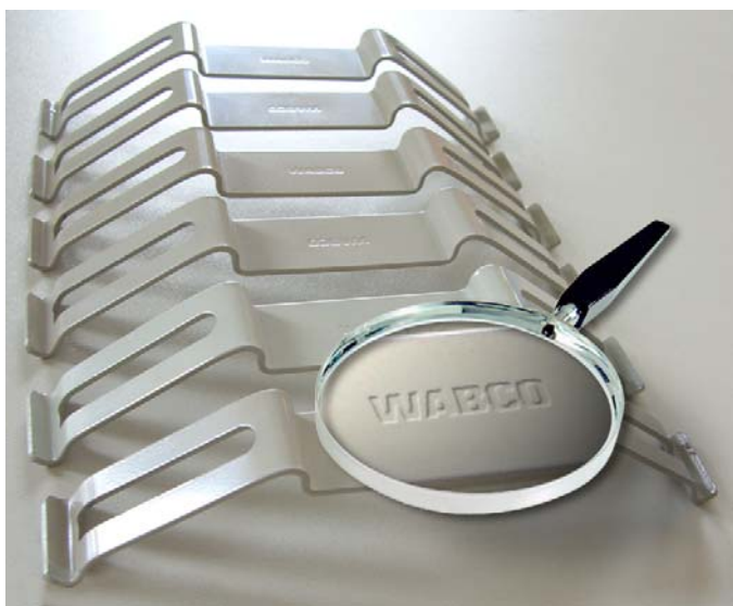
Fig. 3.: Le molle di pressione originali WABCO

Avvisiamo espressamente sul fatto che la WABCO declina qualsiasi richiesta giuridica avanzata nei confronti della stessa in caso di eventuali difetti e danni risultanti per conseguenza.