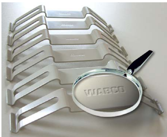
Fig. 3 : Ressorts de maintien WABCO d'origine

Dans le cas où des pièces de rechange non autorisées par WABCO seraient utilisées, nous signalons qu'il est impossible de faire valoir quelque droit que ce soit auprès de WABCO pour vices et dommages pouvant en résulter.