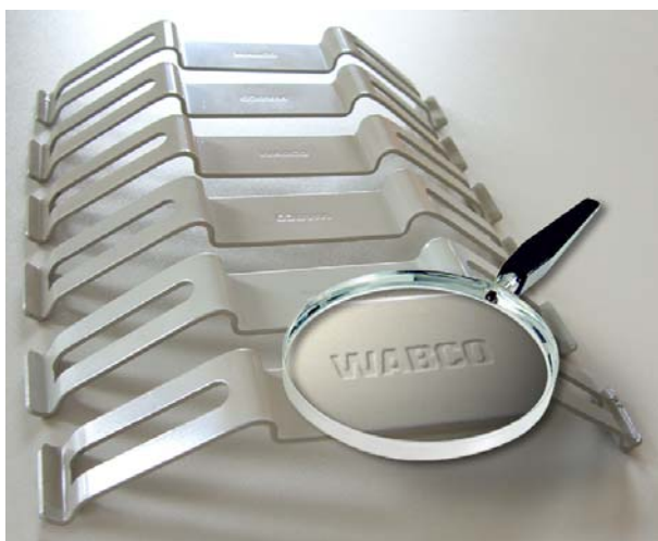
Fig. 3: Muelles de sujeción originales de WABCO

Informamos de que si se utilizan recambios no homologados por WABCO, en ningún caso podrán realizarse reclamaciones legales contra WABCO a causa de defectos y de los daños derivados de los mismos.