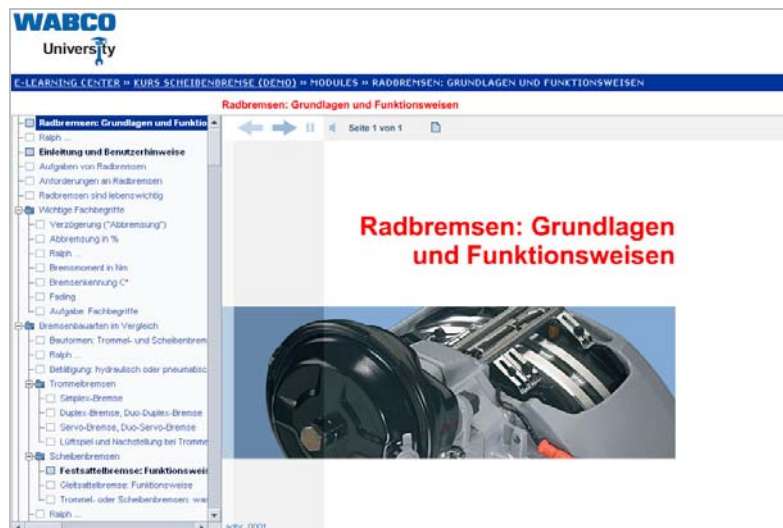
Abb. 1: E-Learning „Scheibenbremse“

Der neue Online-Trainingskurs „Scheibenbremse“ behandelt moderne Radbremsen für Nutzfahrzeuge. Ein Schwerpunkt liegt dabei auf der Druckluft-Scheibenbremse der PAN-Baureihe von WABCO.