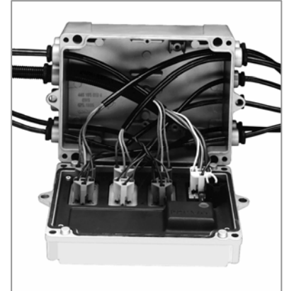
Abbildung: Vario C

Im Folgenden beschreiben wir die bekannte und die neue Lösung im Vergleich.