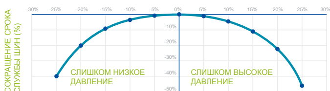
ОТКЛОНЕНИЕ ОТ РЕКОМЕНДУЕМОГО ДАВЛЕНИЯ В ШИНАХ (%)

Отклонение от рекомендуемого давления в шинах на 15 % приводит к сокращению срока службы шин более чем на 10 %**