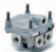
15. مربع شاسية (973 ...)