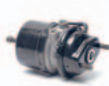
18. كوز فرامل مرحلتين (925 ...) (425 ...) (890 ...)