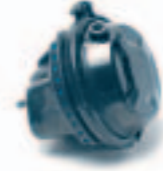
4. ديفرام عجل (423 ...)