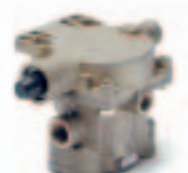
16. موزع مقطورة (971 ...)