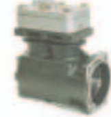
6. كمبرسور هواء (411 ...) (911 ...)