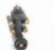
23. حساس فرامل ECAS (441 ...)