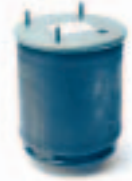
2. قربة هواء (951 ...)