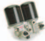
3. مجفف هواء (432 ...)