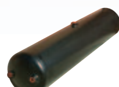
17. تنك هواء (950 ...)