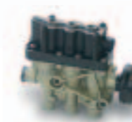
22. سـلونيد ECAS (472 ...)