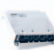
21. وحدة كمبيوتر سيارة ABS ECU (446 ...)