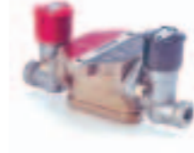
10. بلف تحويله (963 ...)