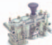
14. أتشوك بطل (463 ...)