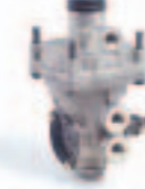
9. بلف حساس حمل (475 ...)