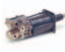
5. سرفو ديرياج (970 ...)