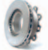
12. طنبورة عجل (13 ...) (640 ...)