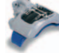
11. دشمة تيل فرامل (40 ...) (640 ...)