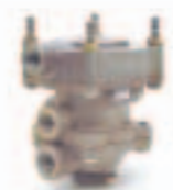
19. قاطع شاسية (973 ...)