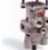
7. بلف دوسة (461 ...)