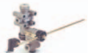
24. بلف قرب (464 ...)