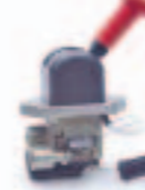
8. فرملة يد (961 ...)