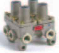
13. بلف رباعي خزانات (934 ...)