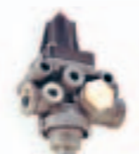
20. سكس بلف (975 ...)